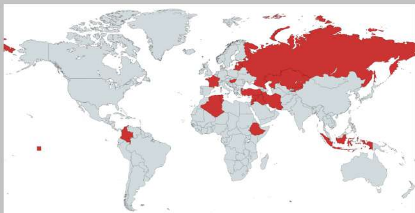
4. ábra. A vizsgált országok