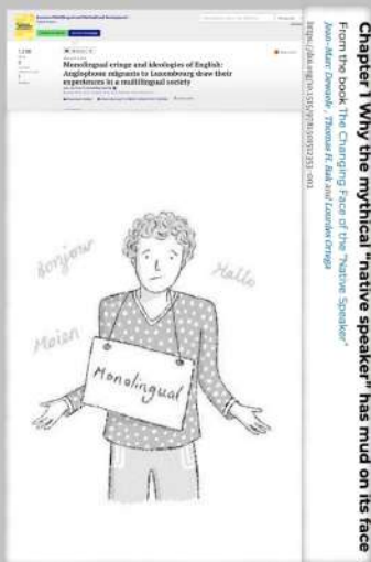
1. ábra. Az egynyelvűség inkább kivétel mint norma