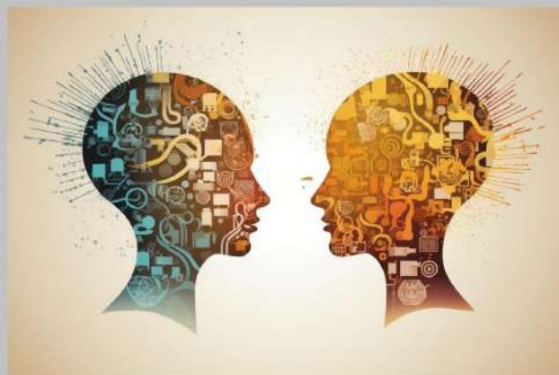
2. ábra. Két- és többnyelvűség (holisztikus megközelítés (Grosjean 1991, 2010), multikompetencia (Cook 1993, 2003), a többnyelvű fordulat (May, 2014))