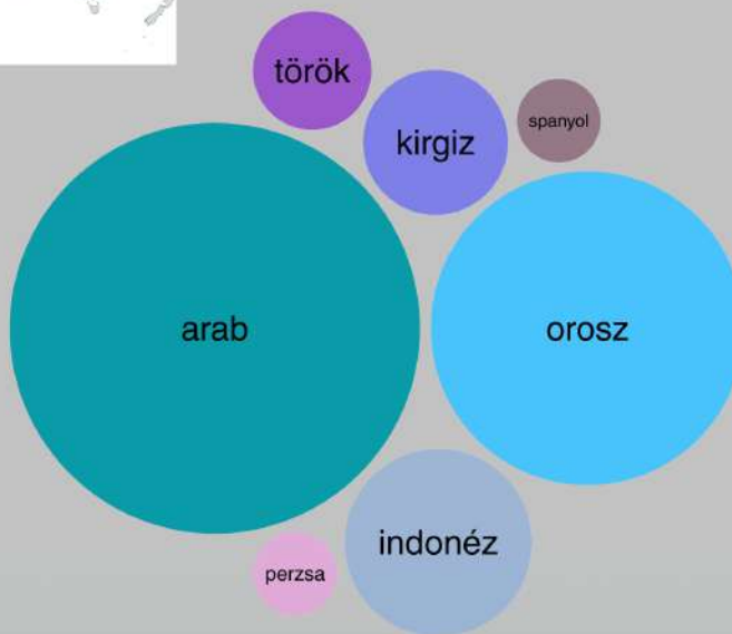
5. ábra. A leginkább vizsgált nyelvek