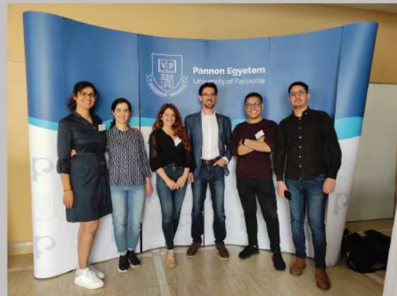
3. ábra. A Többnyelvűégi Nyelvtudományi Doktori Iskola és az alkalmazott nyelvészet mesterszak néhány hallgatója (2022)